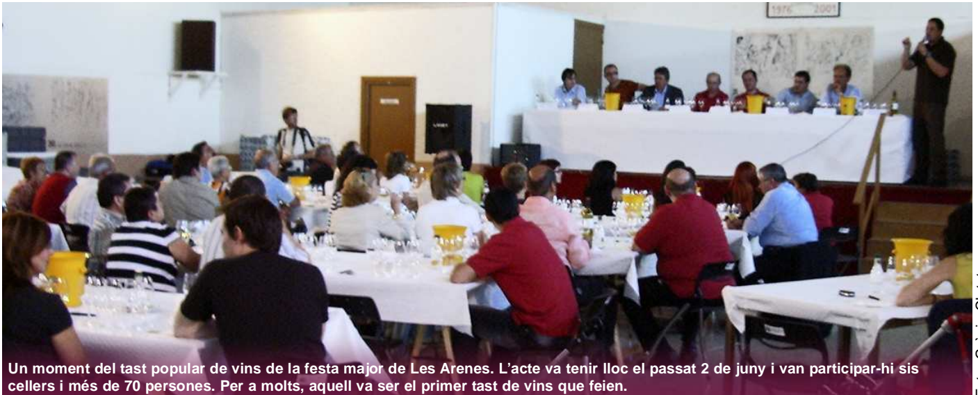
Un moment del tast popular de vins de la festa major de Les Arenes. L'acte va tenir lloc el passat 2 de juny i van participar-hi sis cellers i més de 70 persones. Per a molts, aquell va ser el primer tast de vins que feien.