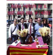
ASCAVI innova el Sant Jordi amb una parada de roses i vi al cor de Barcelona [23/04/2007]

"El vi fa sang i la sang fa la rosa." Amb aquest lema, ASCAVI va participar en el Sant Jordi d'enguany amb una parada de roses i vi que va captar l'atenció dels vianants, tot aportant un element novetós i original a la tradicional diada de la rosa i el llibre.