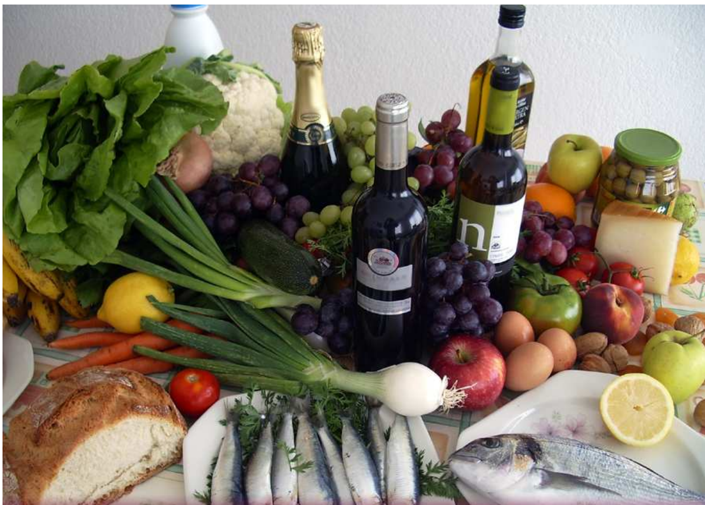
El vi, com l'oli d'oliva o la llet, és aliment. Així ho estableix la Llei del Vi de 2003, que també el considera part integrant (nosaltres pensem que fonamental) de la dieta mediterrània.

Aquesta és una tasca que correspon fer a l'Administració en els seus diferents àmbits de competència i territoris, però en la qual el sector ha d'actuar amb unanimitat i fermesa com a valedor dels seus propis interessos, tot defensant i promovent allò que està reconegut per llei i exigint, per damunt de tot, claredat i coherència. Des d'ASCAVI donarem suport al sector del vi aportant el nostre coneixement en tot allò que pugui ser útil i vigilant de prop el desenvolupament dels esdeveniments sempre en defensa del vi, del mateix sector, del consumidor (a obtenir informació veraç) i de l'interès general ●