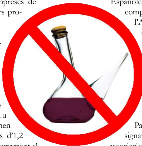
Un dels cartells de la campanya de Sanitat contra l'alcohol

La destitució de Salgado arribava quatre mesos després de la retirada del polèmic avantprojecte de llei de l'alcohol i a vuit mesos de les eleccions generals, previstes per al març de 2008 ●