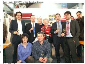
Suplement especial de la revista "Vineles" amb les imatges del Saló Saló d'ASCAVI